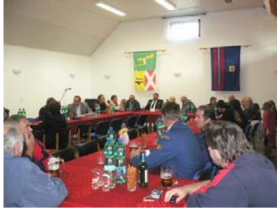
pozvání hasičtí mistři světa